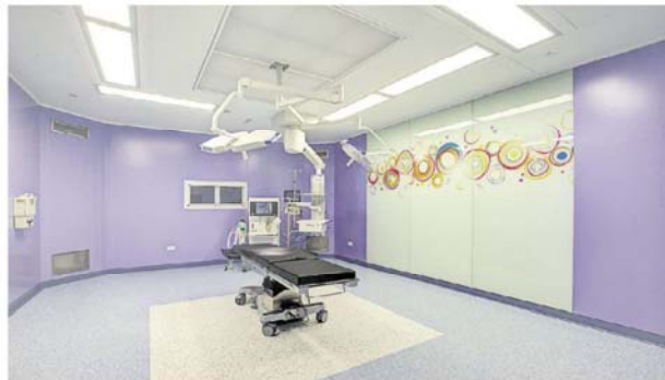
Mediq toteuttaa muuntojoustavat tilat yhteistyössä eri alojen huippuosaajien kanssa.

Teknologioiden valinnassa on painottunut erityisesti muuntojoustavuus. Joenpolven mukaan esimerkiksi ilmanvaihtoratkaisua valitessa on otettu huomioon, että niin sanotut latoleikkaussalit voivat olla tulevaisuutta. Välikaton kannakoinnilla on taas haettu vapaampia mahdollisuuksia sijoittaa hoitolaitteita ja ottaa käyttöön uusia menetelmiä.