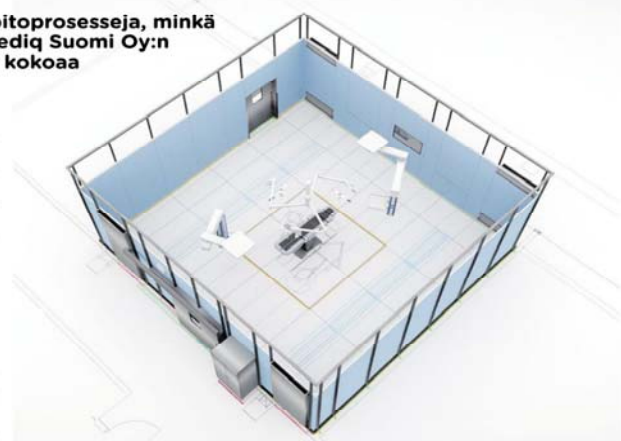
Muuntojoustavat tilat kootaan moduuleista haluttuun muotoon. Tarpeiden muuttuessa niiden järjestystä voidaan helposti vaihtaa.

Joenpolvi ja Maaninen näkevät, että muuntojoustavat ratkaisut tekevät vahvasti tuloaan suomalaisiin sairaaloihin. Täälläkin