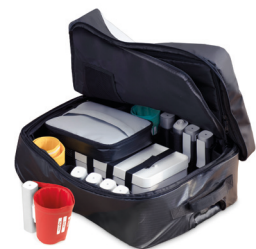
MESI mTABLET Bag -laukku