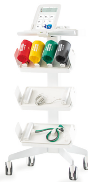
MESI mTABLET Trolley -vaunu